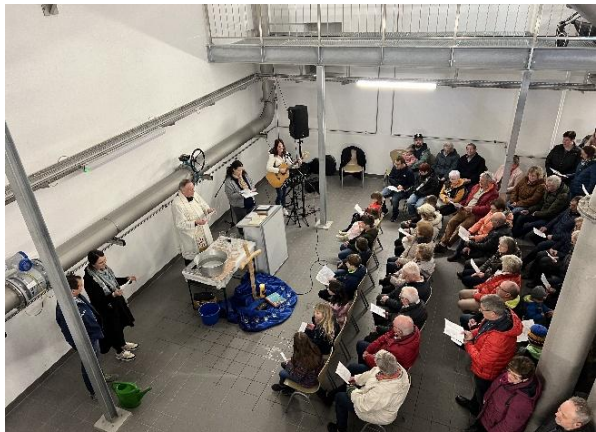
Gottesdienst im Wasserwerk Neresheim