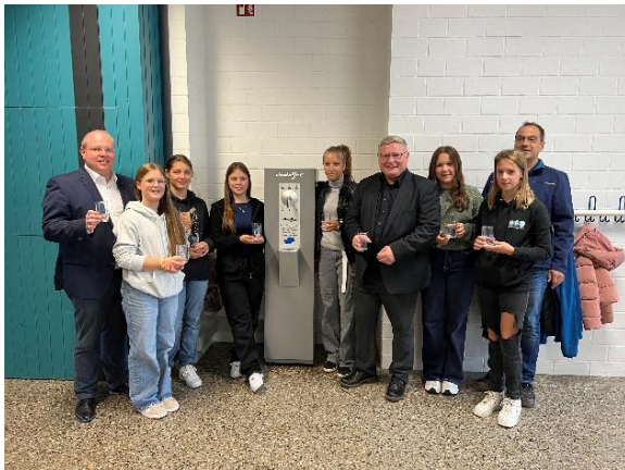
Wasserspenderübergabe Härtsfeldschule Neresheim

Im Jahr 2024 wurden verschiedene Maßnahmen zur Öffentlichkeitsarbeit umgesetzt, um die Bedeutung einer sicheren und zuverlässigen Wasserversorgung stärker ins Bewusstsein der Bevölkerung zu rücken. So wurden unter anderem Wasserspender in Schulen und Kindertagesstätten bezuschusst. Darüber hinaus fand im Rahmen der Heimattage Baden-Württemberg Härtsfeld 2024 ein Gottesdienst im Wasserwerk Neresheim statt, der den Bürgerinnen und Bürgern einen direkten Einblick in die Aufgaben und Prozesse der Wasserversorgung ermöglichte.